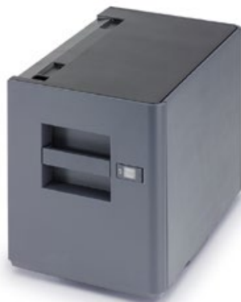
3.000-BLATT- PAPIERMAGAZIN PF-7120 Ideal für hochvolumige Jobs in A4.