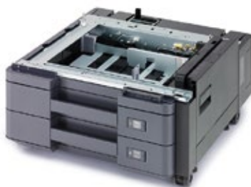
2x 500-BLATT- PAPIERKASSETTE PF-7100 Ideal für Papierformate zwischen A6 und SRA3 (320 mm x 450 mm).