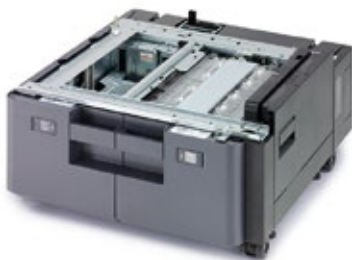
2x 1.500-BLATT- PAPIERKASSETTE PF-7110 Unterstützt A4, B5 und Letter-Formate.